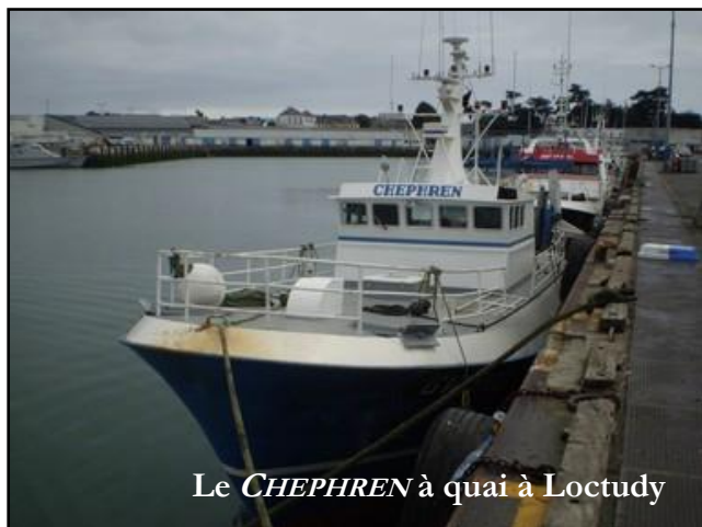
Le CHEPHREN à quai à Loctudy