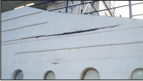
VOLGO-DON 5038 : Pavois arrière bâbord découpé par le panneau de chalut du ÉDOUARD FRANÇOIS.

La visite PSC/MOU de Paris du CSN Sète a ordonné des réparations avant l'appareillage, notamment sur les garde-corps (risques pour les marins).