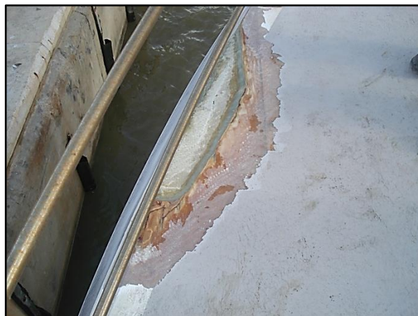
ÉDOUARD FRANÇOIS : vue du livet de pont teugue bâbord en cours de réparation.

Avaries de coque au-dessus de la flottaison sur le chalutier (épaule bâbord au niveau du livet de pont teugue).