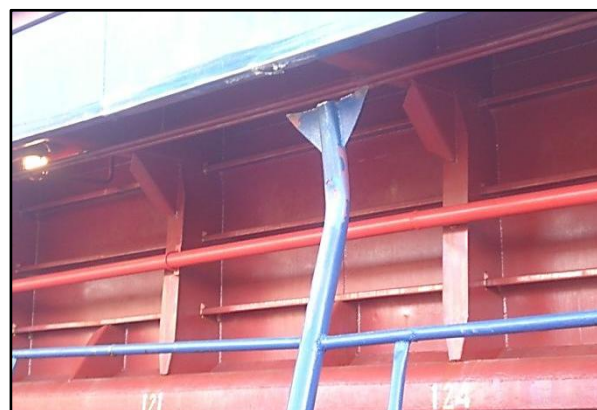
VOLGO-DON 5038 : batayolles et épontille abimées côté bâbord.

Avaries sur les garde-corps et épontilles passant bâbord ainsi que sur le pavois arrière, provoquées très probablement par le panneau de chalut bâbord, maillé au poste de mer, sur le portique du chalutier.