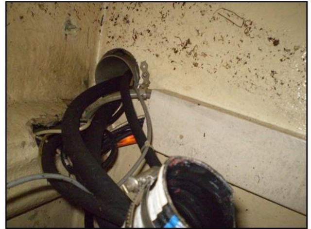
Sortie de la goulotte en PVC dans le poste avant.

Aucune tentative de fermeture de la vanne de coque ne semble avoir été effectuée.