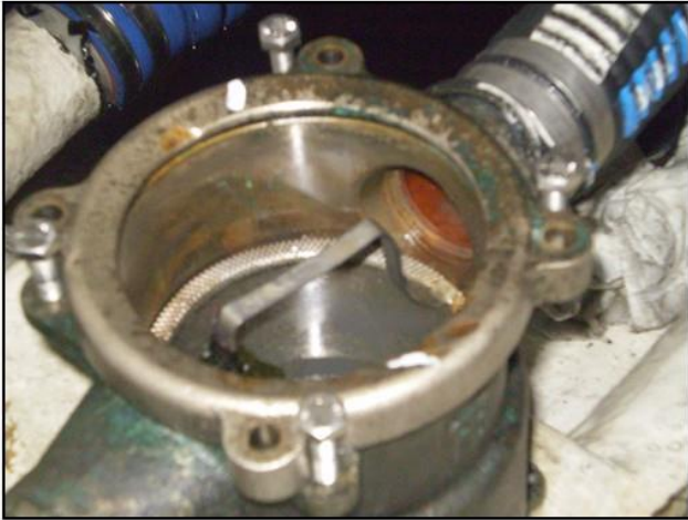
Dessus du filtre à eau de mer sans le couvercle.

Le BEAmer observe que le couvercle du filtre, d'une épaisseur de 5 mm, n'avait pas été remplacé alors que celui-ci était fêlé. Il n'a pas fondu pendant l'incendie mais a éclaté en plusieurs morceaux.