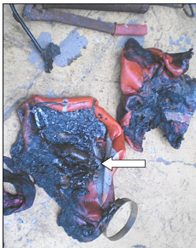
Débris calcinés des bidons et de la baladeuse.

Par contre, les restes d'une baladeuse électrique ont été retrouvés fondus parmi les bidons calcinés (cf. photo ci-dessous), l'hypothèse que cette baladeuse restée allumée soit à l'origine de l'incendie paraît plus vraisemblable que le néon.