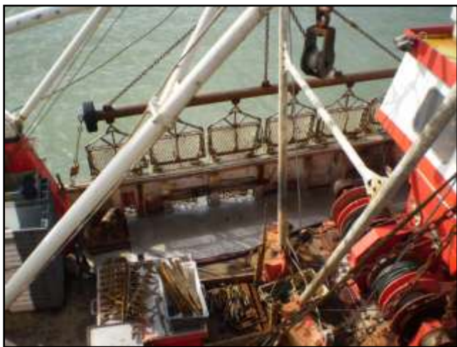
Présentation du bâton et de ses 6 dragues le long du bordé de pavois.

À 15h07 , pour cette opération, le patron et un matelot se mettent aux commandes du treuil. Les deux autres matelots sont à la manœuvre de positionnement des dragues. Un des matelots se prend, sans s'en rendre compte, le pied droit dans une