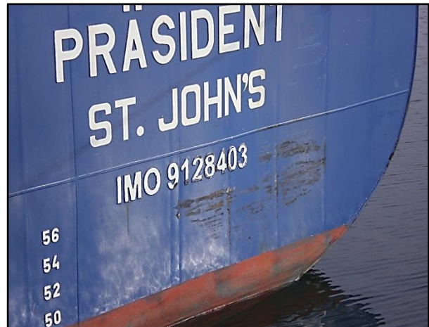
Depression of the transom plate