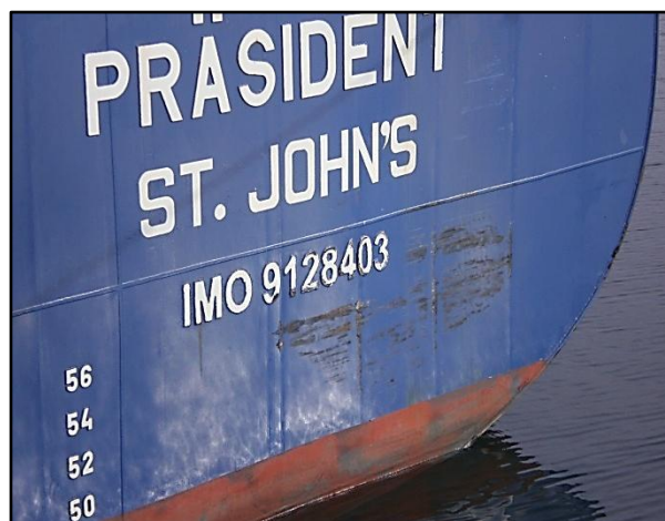
Enfoncement du tableau arrière