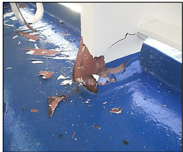
Aft bulwark depressed in the middle

The first investigations have shown the following damages: