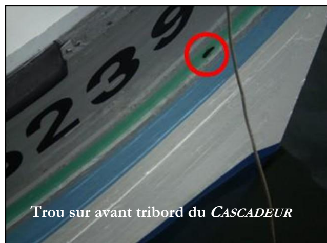
Trou sur avant tribord du CASCADEUR

Le CASCADEUR a eu, quant à lui, deux antennes fouet de cassées et un trou sur son tribord avant bien au-dessus de la flottaison, sans conséquence sur le flotteur.