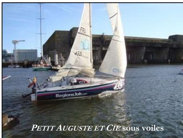
PETIT AUGUSTE ET CIE sous voiles

Le voilier PETT AUGUSTE ET CIE immatriculé B90349 est un navire de plaisance en polyester/epoxy construit en 2003.