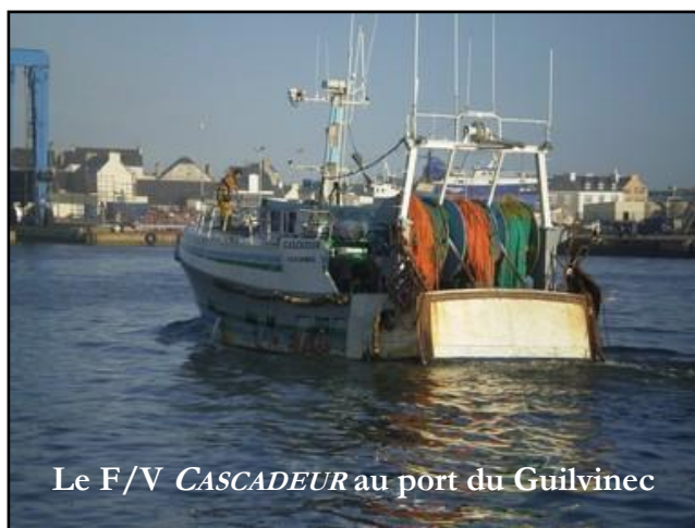
Le F/V CASCADEUR au port du Guilvinec

Le navire de pêche CASCADEUR , construit en